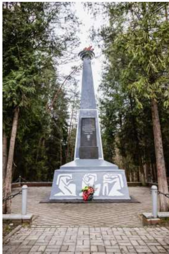
У памятника жертвам гетто всегда лежат цветы...(слайд)