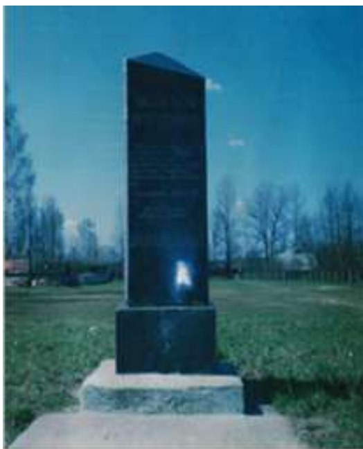
Памятник сожженным жителям д. Мстиж (Слайд)