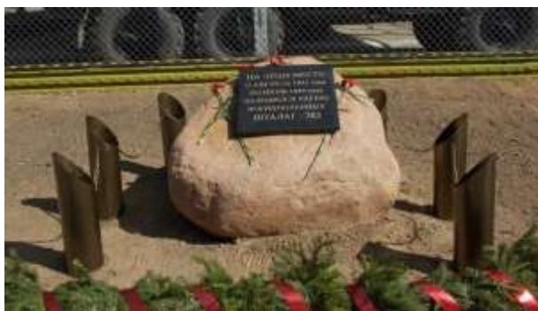
Воинский мемориал «Жертвам фашизма».