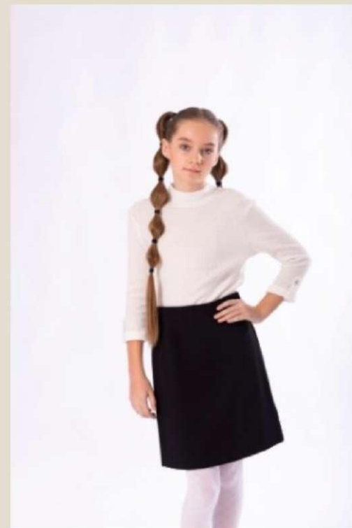
Блузка для девочки Модель ДТ-4415-Ш22 Хлопок 95%, эластан 5%, 76-88/152-170