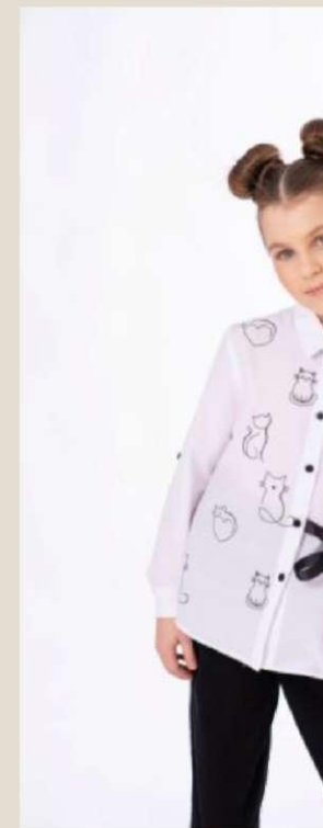
Блузка для девочки Модель ДХ-4 Хлопок 70%, ПЭ 27% 60-76/122