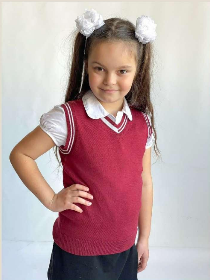
Жилет для девочки Модель 8841/8844 Хлопок 50%, ПАИ 50% 60-72/122-146 76-88/152,164 Цена: 19,50-21,50 BYN без НДС