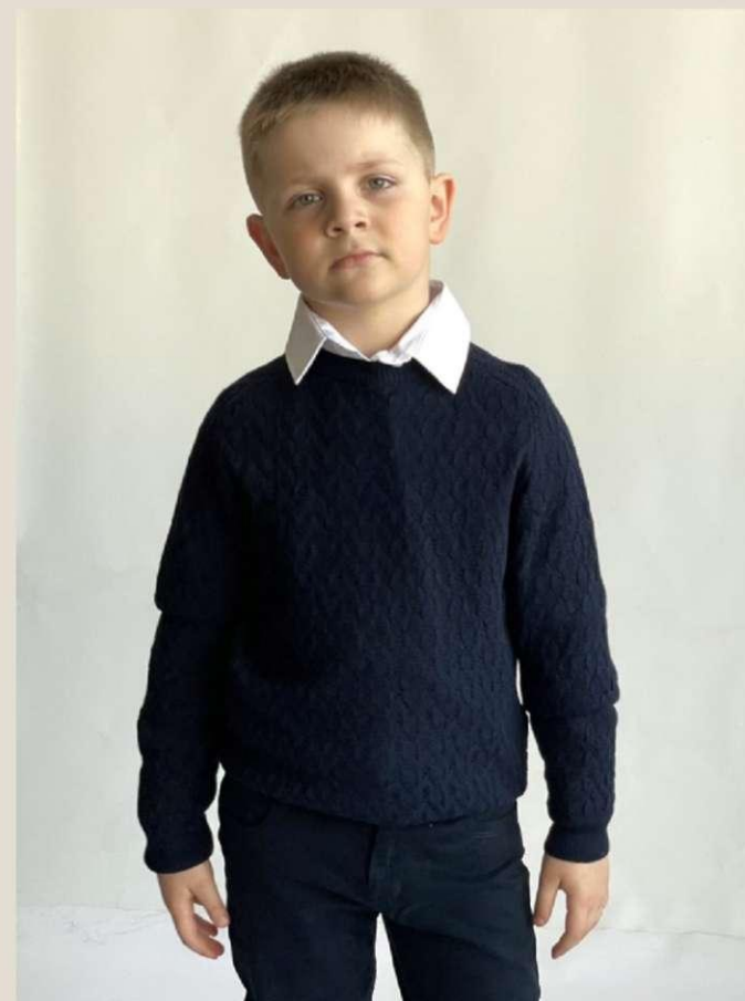
Дже для м Мод Хлопок 5 60-72 Ц 28,00 BYN