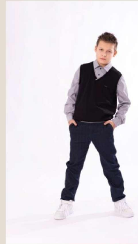
Джемпер для мальчика Модель ДТ-4221-Ш22 вискоза 73%, ПА 22%, спандекс 72-84/152-176