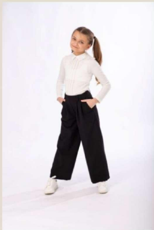
Брюки для девочки Модель ДП-4520-Ш22 Вискоза 22%, ПЭ 72%, спандекс 6% 76-88/152-170