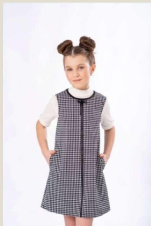
Сарафан для девочки Модель ДТ-4330-Ш22 Вискоза 26%, ПЭ 62%, ПА 11%, спандекс 1% 60-76 / 122-152