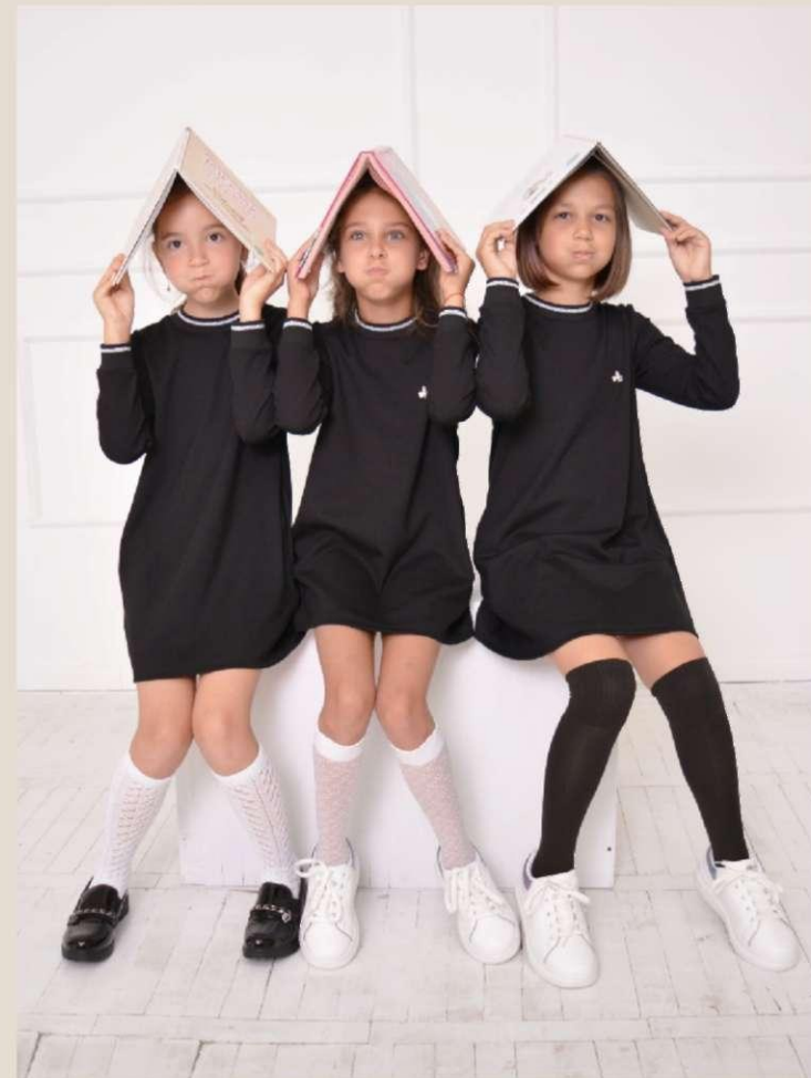
Платье для девочки Модель 818101 хлопок 75%, ПЭ 20%, ПУ 5% 60-76 / 122-152 Цена: 15,0 BYN без НДС