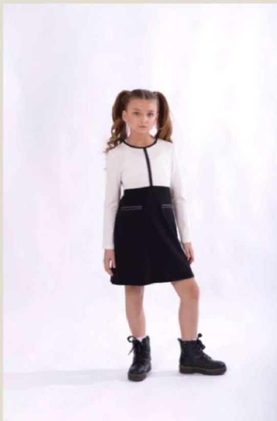
Платье для девочки Модель ДТ-4523-Ш22 вискоза 73%, ПА 22%, спандекс 5% 60-76/122-152