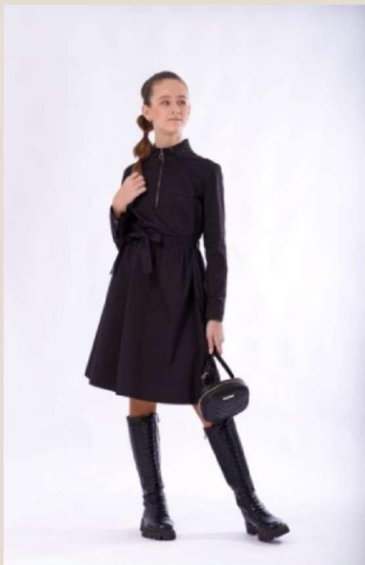
Платье для девочки Модель ДХ-4305-Ш22 Хлопок 100% 80-88/152-170